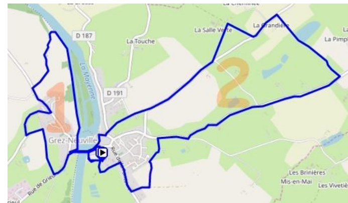
Boucle 1 commune aux courses 4.9 km et 13 km

Je m'engage à respecter l'environnement et les sites traversés par la course, à ne pas abîmer les végétaux et à rester sur les routes balisées par l'organisation. Les parties privées du parcours sont interdites à tous coureurs, en dehors du jour de la course